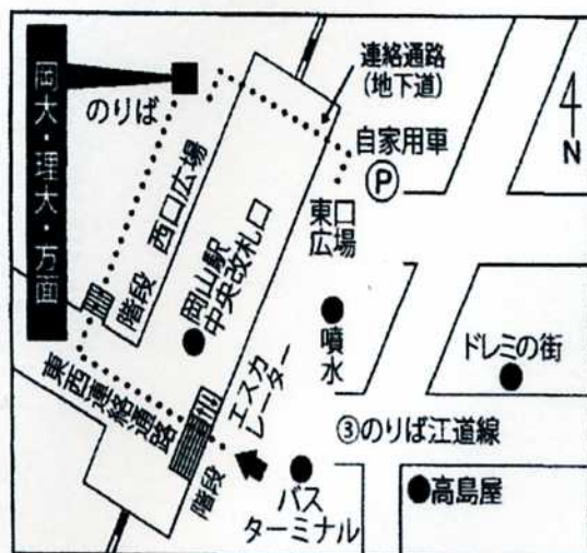
岡山駅バス停位置図